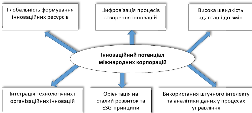
Рис. 1. Основні характеристики інноваційного потенціалу міжнародних корпорацій, узагальнено авторами на основі [1-8]

Інноваційний потенціал міжнародної корпорації доцільно розглядати як інтегровану сукупність ресурсів, компетенцій, технологій, організаційних можливостей та управлінських механізмів, які забезпечують здатність корпорації генерувати, впроваджувати та комерціалізувати інновації в умовах глобального середовища. В умовах цифрової економіки традиційні джерела конкурентних переваг поступово втрачають визначальне значення, поступаючись інтелектуальному капіталу, цифровим платформам, штучному інтелекту, інноваційним екосистемам та мережевим формам взаємодії. Так, основними характеристиками інноваційного потенціалу міжнародних корпорацій у сучасних умовах визначено наступні (рис. 1):